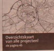
Overzichtkaart van alle projecten!