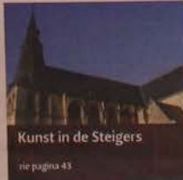
Kunst in de Steigers